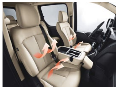
חימום מושבים קדמיים*