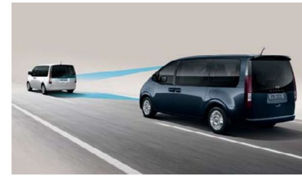
בקרת שיוט חכמה (SCC) שומרת על מהירות ומרחק קבועים מהרכב שמלפנים בעזרת חיישן רדאר ושולטת בהאצה והאטת הרכב באופן אוטונומי עד עצירה מוחלטת.