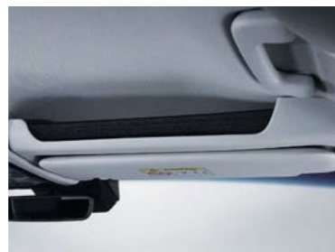
תא אחסון עליון