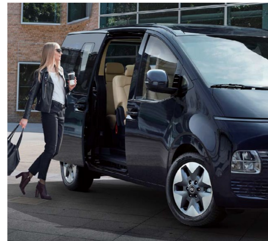
מפתח רחב הדלתות ביונדאי סטאריה מעוצבות בצורה המאפשרת כניסה ויציאה נוחה ונינוחה במיוחד.