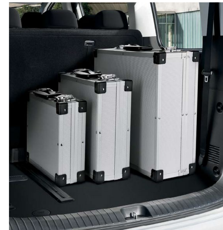
תא מטען מרווח תא המטען בנפח של עד 1,303 ל' (בהזזת המושבים קדימה) יאפשר לכם להכניס בנוחות את כל הציוד הנדרש לכם, למשפחה, ולכלל הנוסעים.