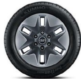
חישוקי סגסוגת " 18 (דגם Luxury בלבד)