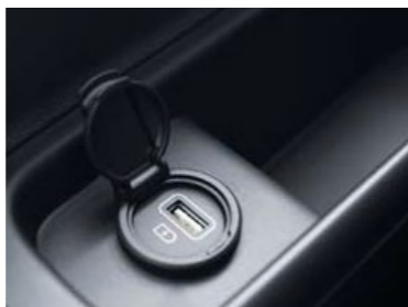
שקעי USB בכל המושבים*