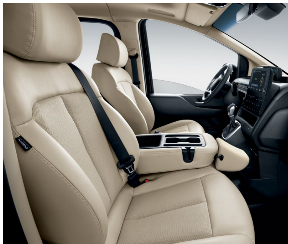
קונסולה מרכזית הניתנת להרמה והפיכתה למושב נוסע נוסף.

ליונדאי STARIA שפע תאי אחסון ומאפייני נוחות שימושיים בחלל הפנימי, כגון מערכת המולטימדיה המתקדמת ומערך מצלמות היקפיות. למכונית מתקדמת מגיע אבזור מתקדם.