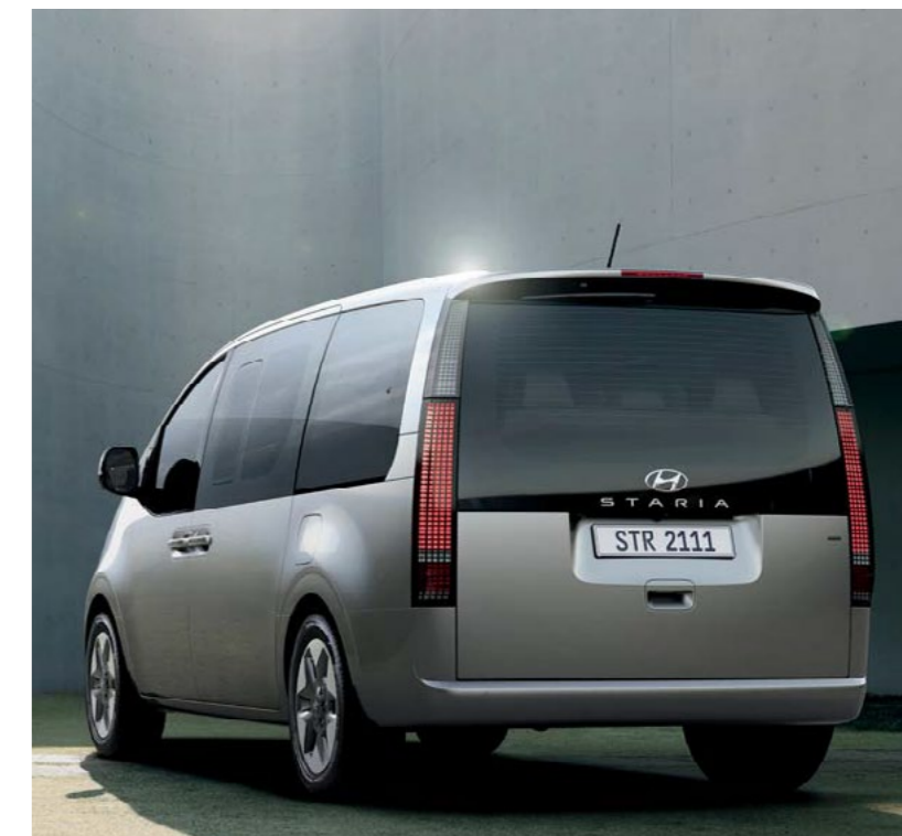
פנסים אחוריים מסוג LED עם פיקסלים משתנים