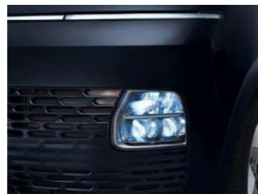
תאורת LED קדמית*