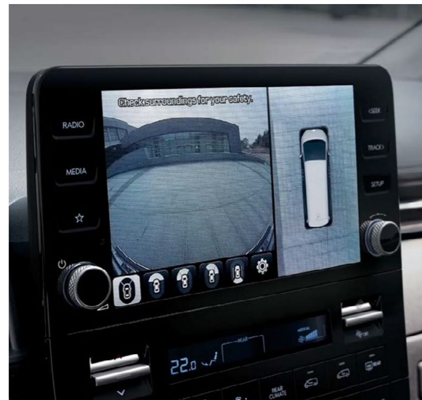
מערך מצלמות היקפיות (AVM)* יונדאי סטאריה מצוידת במערך 4 מצלמות היקפיות המאפשר זווית עין בכל זמן, של כלל סביבת המכונית.