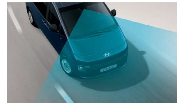
מערכת סיוע לשמירה על מרכז נתיב הנסיעה (LFA) מערכת אקטיבית המסייעת בשמירה על מרכז נתיב הנסיעה.