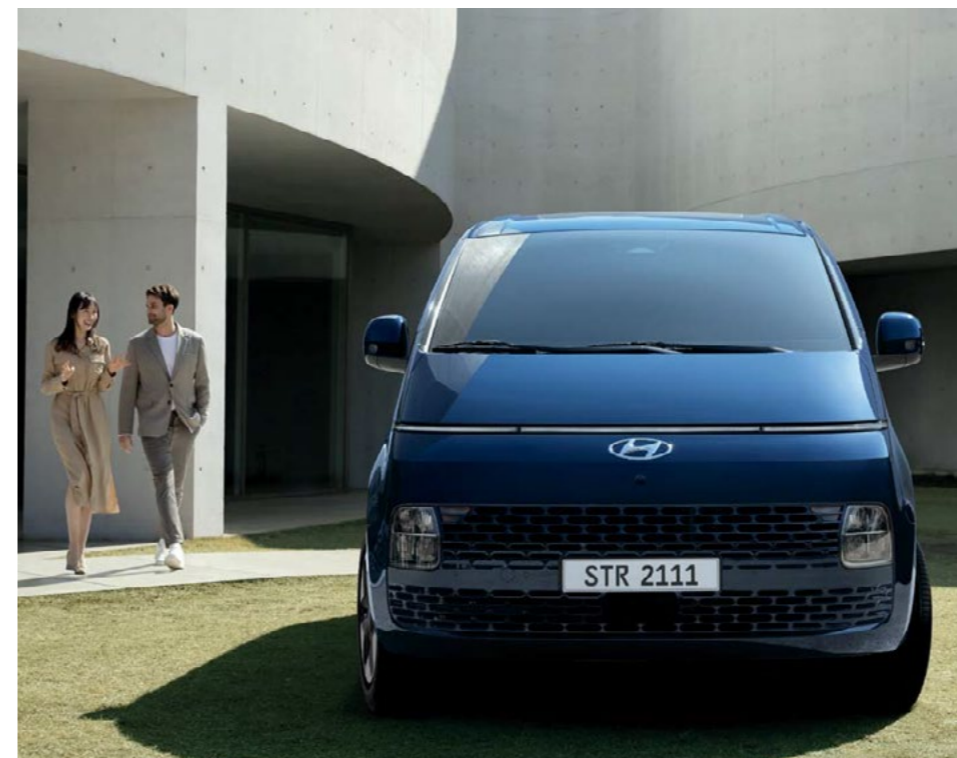
פנסים קדמיים מסוג LED