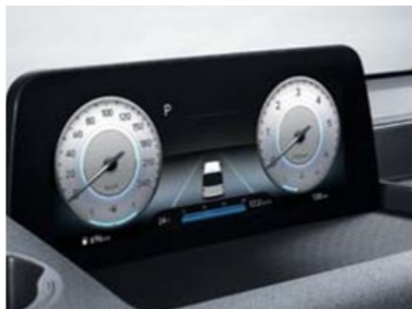
לוח מחוונים דיגיטלי *10.25