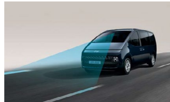
מערכת אקטיבית הכוללת תיקון הגה לשמירה על נתיב הנסיעה (LKA) מערכת אקטיבית הכוללת תיקון הגה לסיוע בשמירה על נתיב הנסיעה.