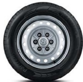
צלחות קישוט " 17 (דגם מסחרי בלבד)