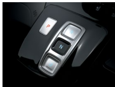
SBW (Shift By Wire) בחירת הילוך נסיעה בכפתור*