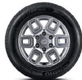
חישוקי סגסוגת " 17 (דגם Premium בלבד)