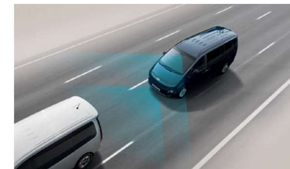
בלימה אוטונומית במצבי חירום (FCA) מערכת בלימה אוטונומית במצבי חירום הכוללת זיהוי הולך רגל, כלי רכב ודו-גלגלי.