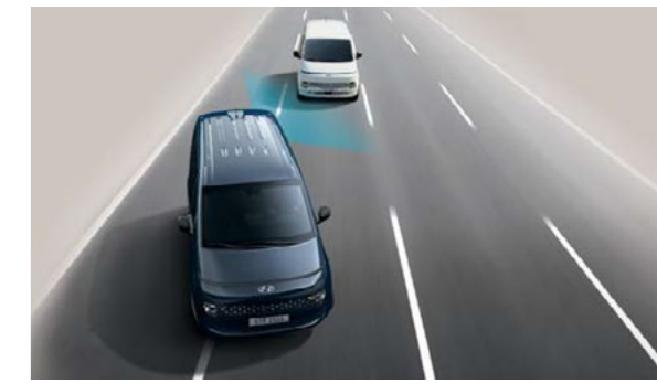
מערכת אקטיבית לזיהוי ומניעת התנגשות בכלי רכב ב"שטח מת" (BCA) מערכת אקטיבית למניעת התנגשות בעת מעבר נתיב המספקת התרעה על רכב ב"שטח מת".