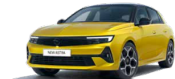
צהוב מטאלי | AMBER YELLOW