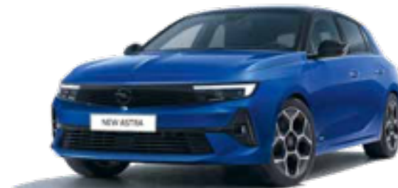
כחול מטאלי | BLUE VERTIGO