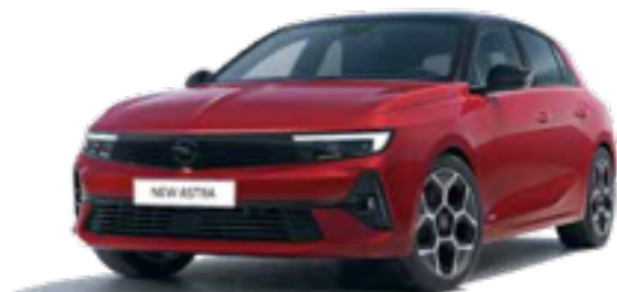
אדום מטאלי | PEPERONICINO RED

18" Allow wheel, Diamond Cut Bi-Colour with Grey wheel