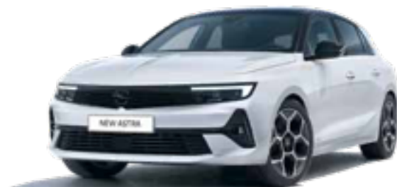
לבן בנקיז | BLANK BANQUISE