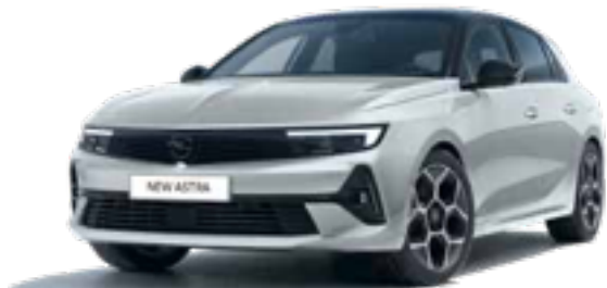
אפור מטאלי | ALUMINUM GREY