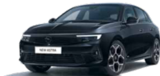
שחור מטאלי | PERLA NERA BLACK