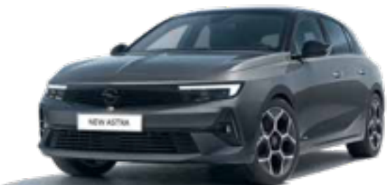
אפור פלטינום מטאלי | PLATINUM GREY