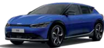
Yacht Blue (DU3)