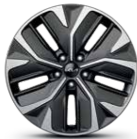
חישוקי סגסוגת 19 אינץ' (Premium)