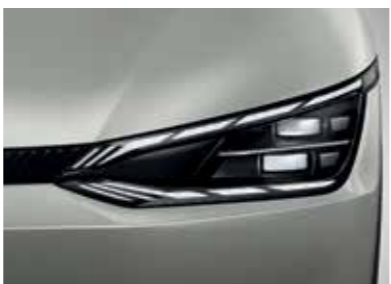
פנסים ראשיים IFS LED (בדגם GT-Line)