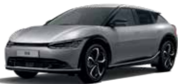
Moonscape (KLM)* צבע בתוספת תשלום*