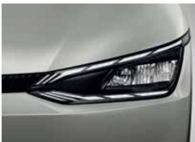
פנסים ראשיים MFR LED (בדגם Premium)