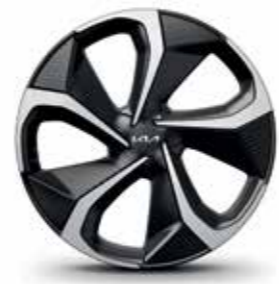
חישוקי סגסוגת 20 אינץ' (GT-line)