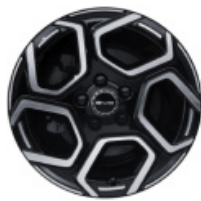
חישוקי סגסוגת אלומיניום בשילוב שני צבעים