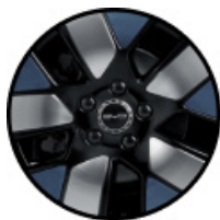
חישוקי סגסוגת אלומיניום בשילוב שלושה צבעים