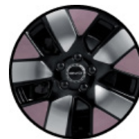
חישוקי סגסוגת אלומיניום בשילוב שלושה צבעים