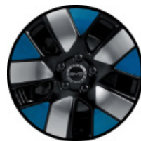
חישוקי סגסוגת אלומיניום בשילוב שלושה צבעים