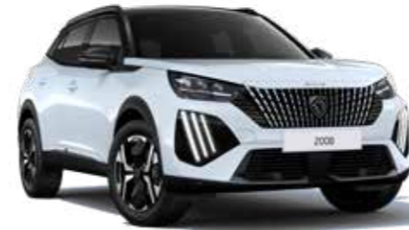
לבן מטאלי OKENITE WHITE