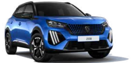
כחול פנינה מטאלי VERTIGO BLUE