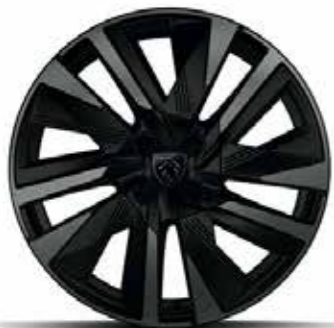
חישוקי סגסוגת 18" EVISSA GT