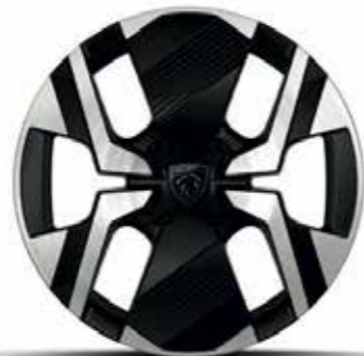
חישוקי סגסוגת 17" KARAKOY ALLURE