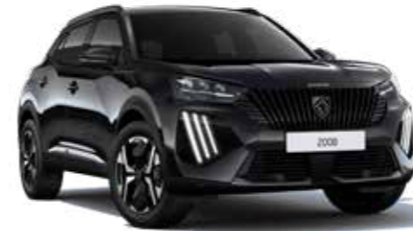
שחור מטאלי NERA BLACK