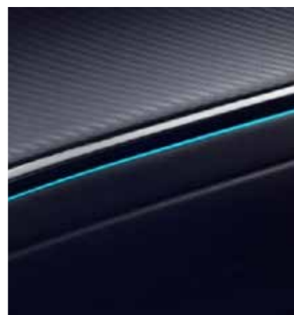
תאורת אווירה הניתנת להתאמה אישית