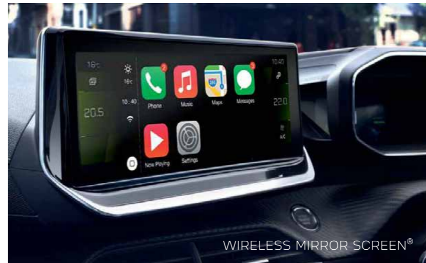
WIRELESS MIRROR SCREEN®