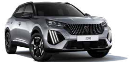
כסוף כהה מטאלי ARTENSE GREY