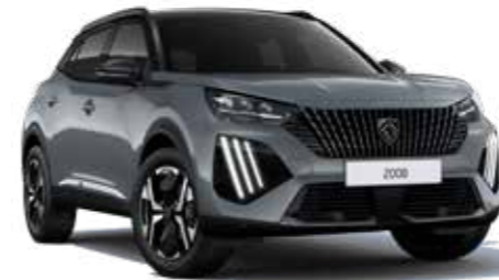
אפור כהה מטאלי SELENIUM GREY