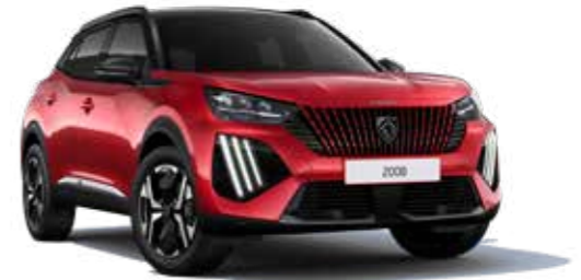
אדום מטאלי ELIXIR RED