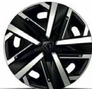
חישוקי סגסוגת 16" SILOM ACTIVE