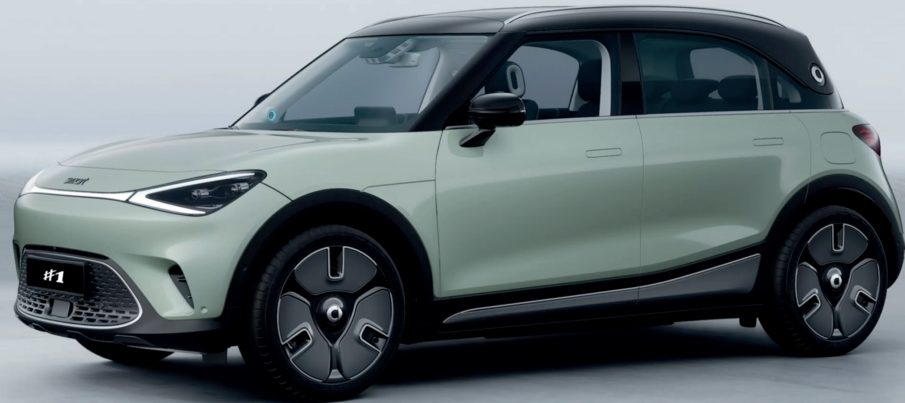
התמונות להמחשה בלבד

*נתוני טווח הנסיעה וצריכת החשמל מתפרסמים על פי דין לפי בדיקות המעבדה. טווח הנסיעה וצריכת החשמל בפועל מושפעים, בין היתר, גם מתנאי הדרך, מתחזוקת הרכב, ממאפייני הנהיגה ומקיבולת ובלאי הסוללה, ועל כן הם יכולים להיות שונים בהשוואה לנתוני המעבדה. הטווח המצויין מתייחס לדגם Premium/Launch Edition.