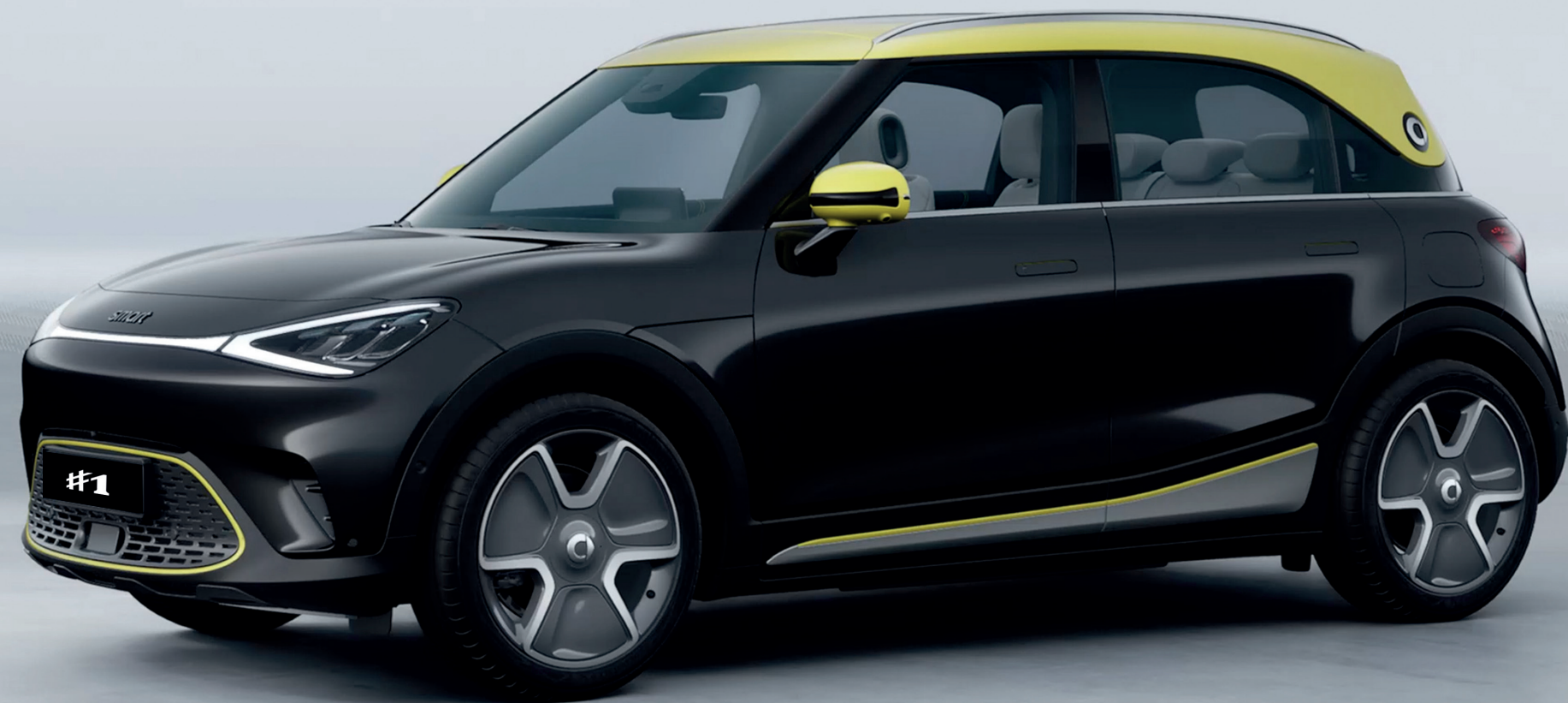
התמונות להמחשה בלבד

*נתוני טווח הנסיעה וצריכת החשמל מתפרסמים על פי דין לפי בדיקות המעבדה. טווח הנסיעה וצריכת החשמל בפועל מושפעים, בין היתר, גם מתנאי הדרך, מתחזקות הרכב, ממאפייני הנהיגה ומקיבולת ובלאי הסוללה, ועל כן הם יכולים להיות שונים בהשוואה לנתוני המעבדה. הטווח המצויין מתייחס לדגם Pro+.