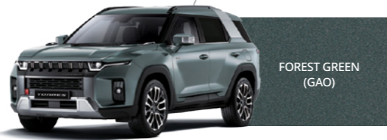
FOREST GREEN (GAO)