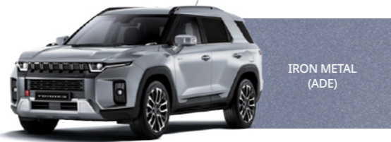
IRON METAL (ADE)