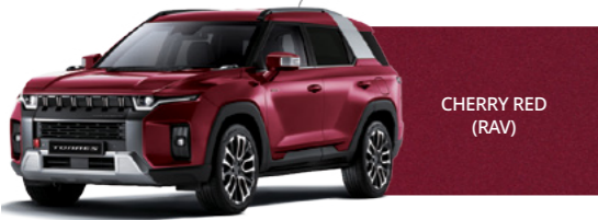
CHERRY RED (RAV)