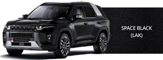
SPACE BLACK (LAK)